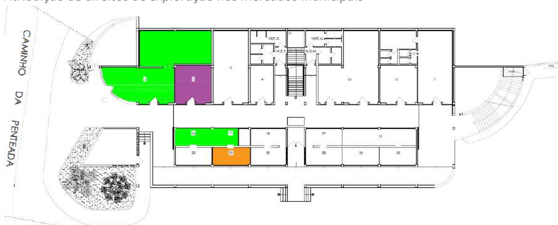
Planta do piso terreo

Atribuição de direitos de exploração nos mercados municipais