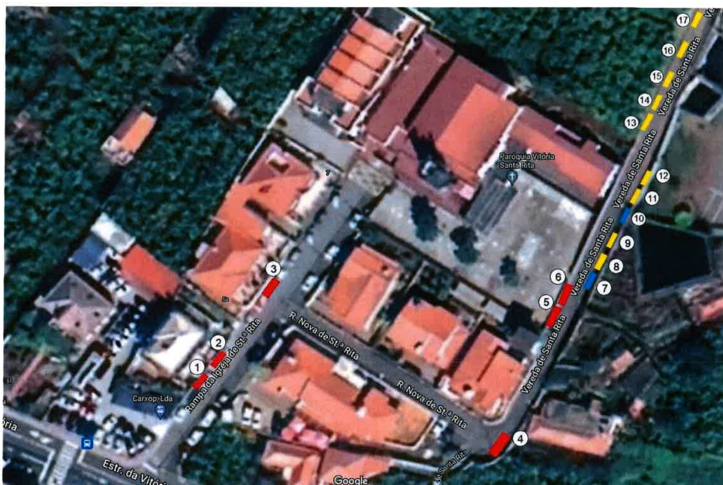
Mapa das ocupações

Espaços de venda ambulante e Restauração não sedentária